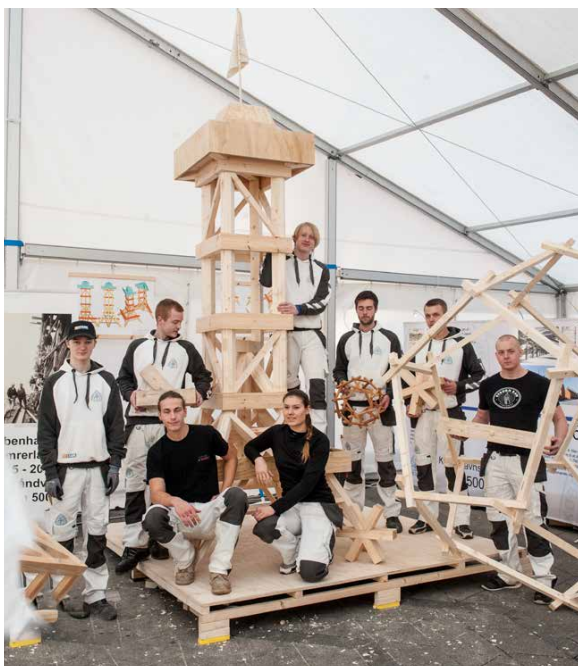
Unge tømmerlærlinge lavede en model af trætårnet i Zoo.

• Laugets logo måtte også ændres og have nyt årstal – desuden blev det renetegnet og digitaliseret.