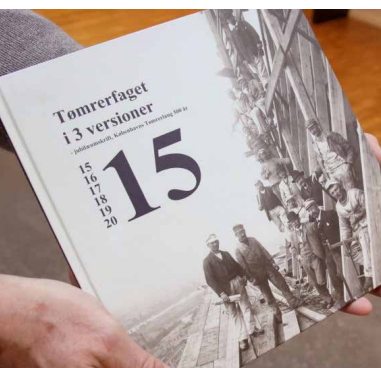
Københavns Tømrerlaug udgav bogen Tømrefaget – i 3 versioner ved 500-års jubilæet.